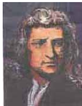
Retrato de Isaac Newton.

«No es extraño que en sus consejos nos planteen la regla de la naturaleza para conocer el gran secreto tanto para la medicina como para la transmutación», escribe el gran científico, con un lenguaje enrevesado, en el manuscrito redescubierto. El texto está escrito en inglés, explican los especialistas, pero no es fácil averiguar qué es exactamente lo que dice Newton. «Los alquimistas eran famosos por registrar sus métodos y teorías en lenguaje simbólico o en código para que los profanos no lo entendieran», recuerda la Royal Society.