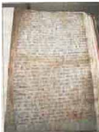
El manuscrito de Newton. Royal Society

Isaac Newton fue, Indudablemente, uno de los más importantes científicos de la historia y su afilado ingenio revolucionó las matemáticas y la física con descubrimientos fundamentales sobre la gravitación, las leyes del movimiento, el cálculo o la óptica, entre otros. Pero además de explicar por qué una manzana cae al suelo, según la famosa leyenda sobre la ley de la gravedad. Newton (nacido en 1643) era alquimista.