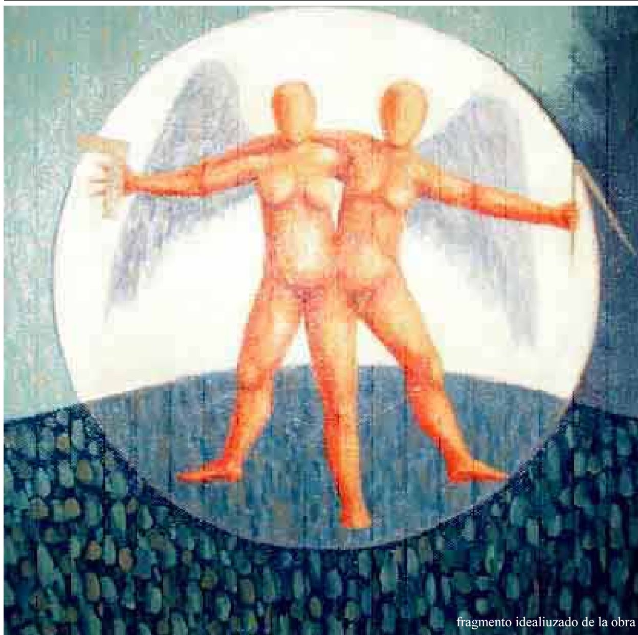
fragmento idealizado de la obra

La revista se edita procurando la Unidad Universal de la Masonería, alcanzable a través de una doctrina aceptable por todos los masones del mundo y basada en «La Unidad en la diversidad».